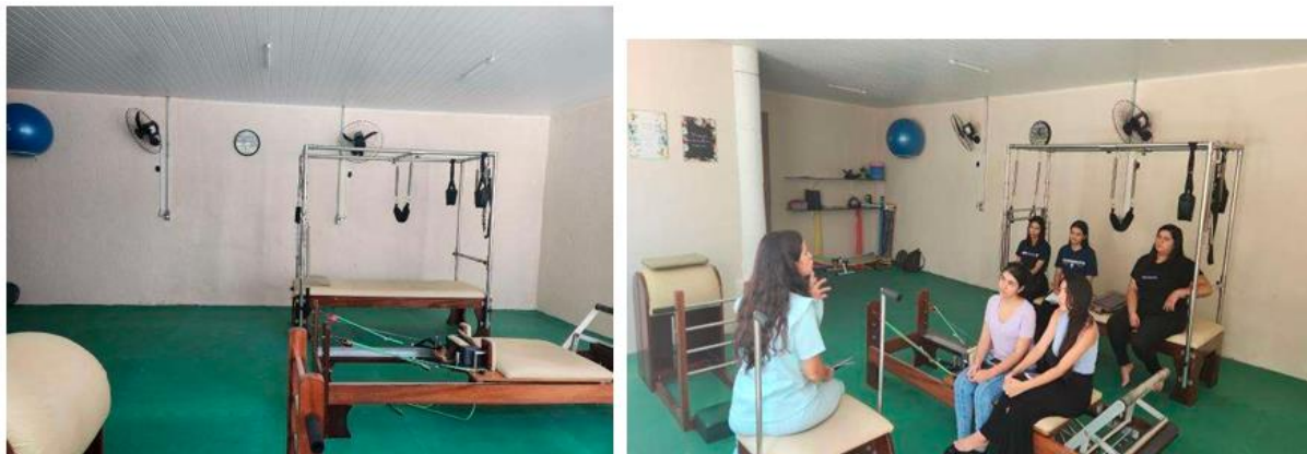
Figuras 10 e 11: salão de pilates do local de execução do projeto