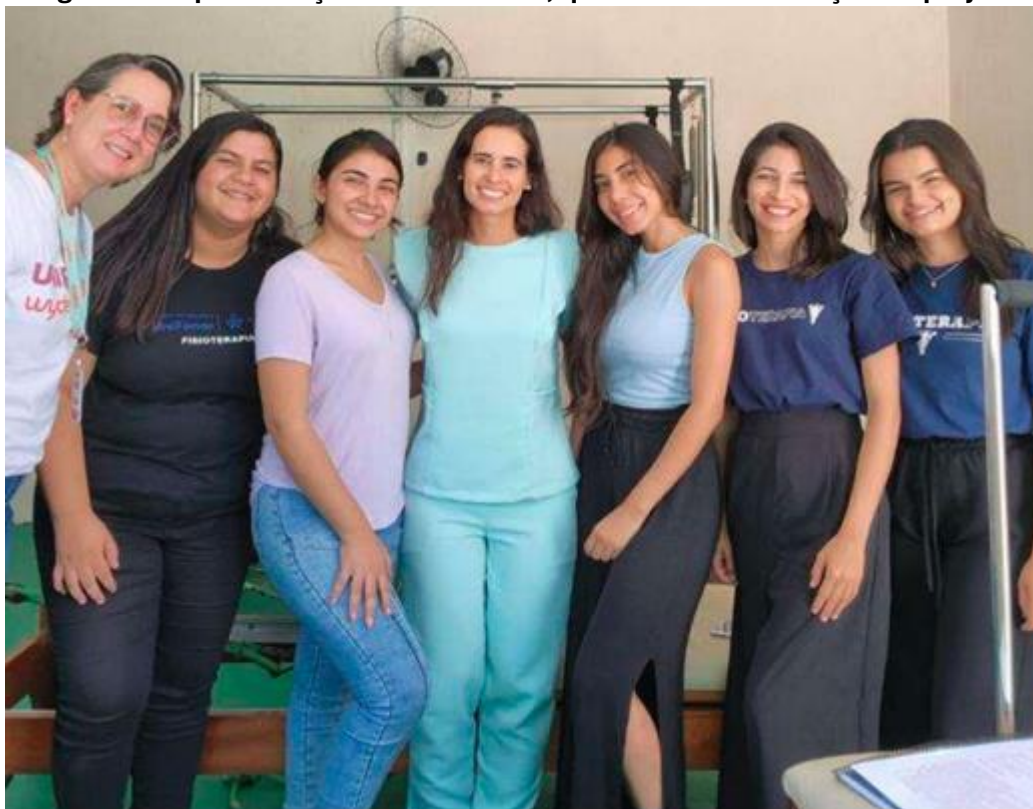
Figura 4: etapa 3 da ação extensionista, que envolve a execução do projeto