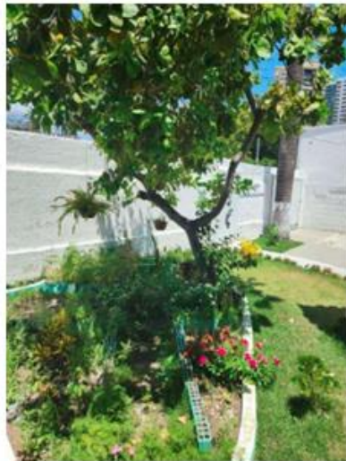
Figuras 4, 5, 6, 7, 8 e 9: ambientes internos e externos do local de execução do projeto