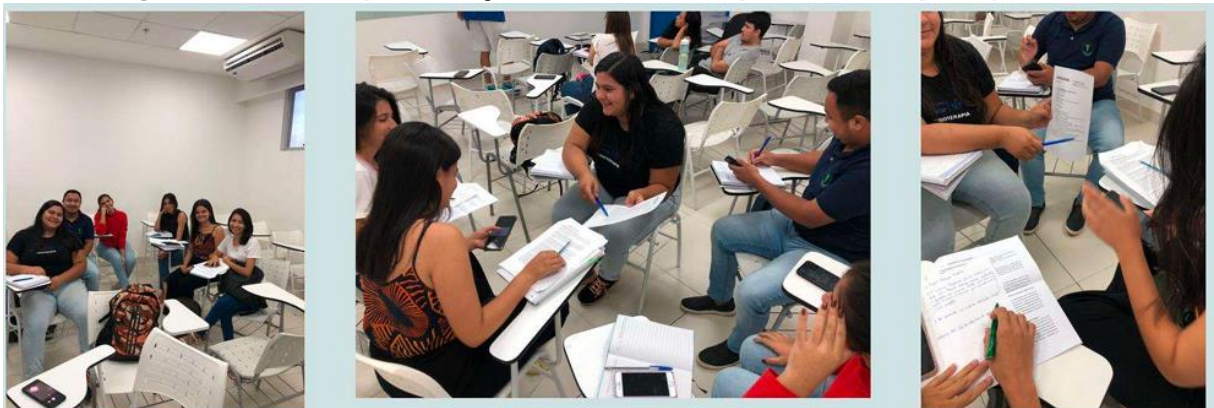
Figuras 1, 2 e 3: etapa 1 da ação extensionista, que envolve o planejamento

Conhecer os espaços físicos da ILPI foi importante para perceber as evidências de que todo o processo de reforma e ajustes do espaço físico foram com o intuito a RDC, oportunizando aos discentes a realizar a conexão da teoria com a prática e de sistematizar o conhecimento, além do desenvolvimento de uma relação de comprometimento com a sociedade, sempre respeitando os valores da população alvo, e reforçando quão importante os estudos em sala de aula e de teorias para o impacto positivo na formação acadêmica.